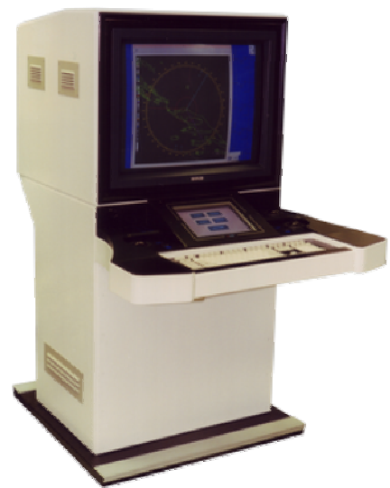
Multifunkcijska konzola (CRT ver.)

Rad MFC-e temelji se na snažnom računalu opće namjene komercijalnog "of-the-shelf" tipa. Dizajnirana je za zadovoljavanje relevantnih vojnih i industrijskih potreba u teškim uvjetima.