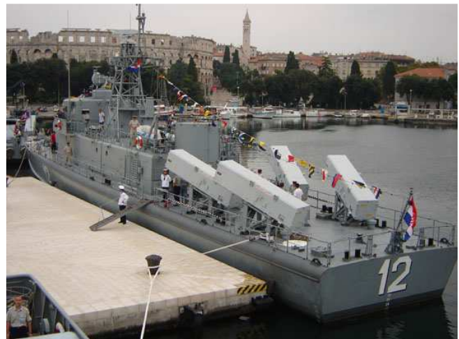
Raketna topovnjača - RTOP-12