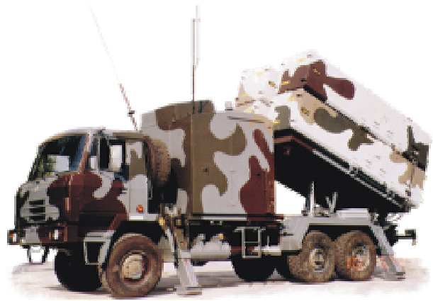
Mobilni obalni lanser - MOL